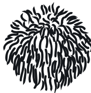
Melena de león